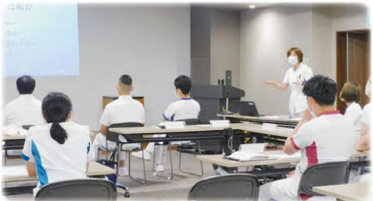
院内研修会の様子