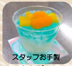
スタッフお手製 セタゼリー