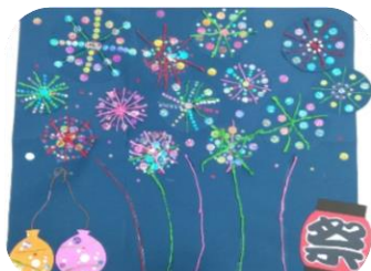
ホールカレンダー(集団創作)