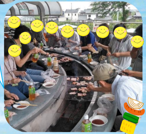
富有柿の里いとぬき