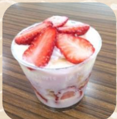
イチゴのカップケーキ