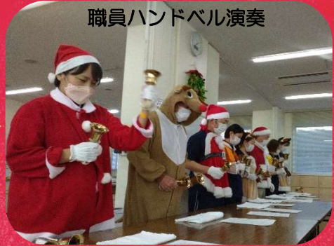
職員ハンドベル演奏

↑重さ当てゲーム：基石をお皿に乗せ、誰が一番 200g に近いかを当てるゲーム。一番近い人は、5g 差でしたよ。すごい!!